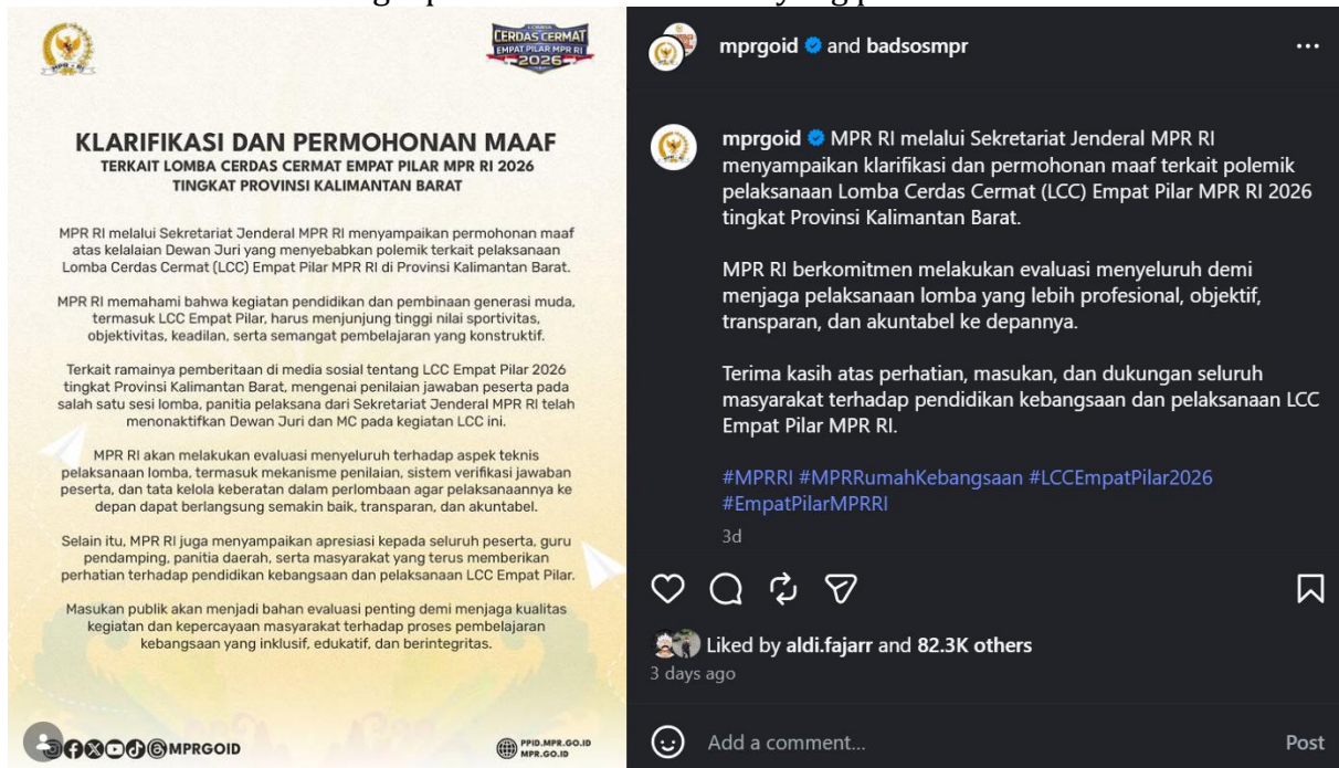
(Gambar 2. Screenshot pernyataan resmi MPR RI di Instagram @mprgoid

narasi bahwa peserta "dirugikan" tapi tidak bisa berbuat apa-apa. Mereka belajar bahwa otoritas juri tidak bisa diganggu gugat dan lebih baik diam daripada protes. Inilah yang dimaksud Foucault sebagai pembentukan individu yang patuh.